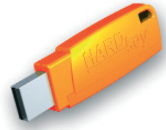
HARDkey NET USB